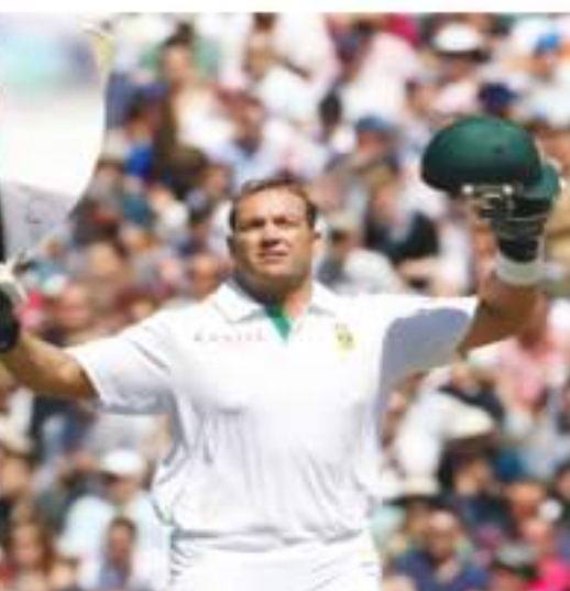
पीटरसन ने कहा कि साउथ अफ्रीका के लीजेंड जैक कैलिस का भी पहले 10 टेस्ट में औसत 22 का ही था, मगर वह बाद में इस खेल के महान खिलाड़ी बने।

खत्म होने के बाद एक्स पर लिखा, कैलिस ने अपने पहले 10 टेस्ट मैचों में 22 की औसत से रन बनाए थे और यकीनन वह इस खेल को खेलने वाले सबसे महान खिलाड़ी साबित हुए। शुभमन गिल को भी समय दो। वह एक सीरियर प्लेयर है।