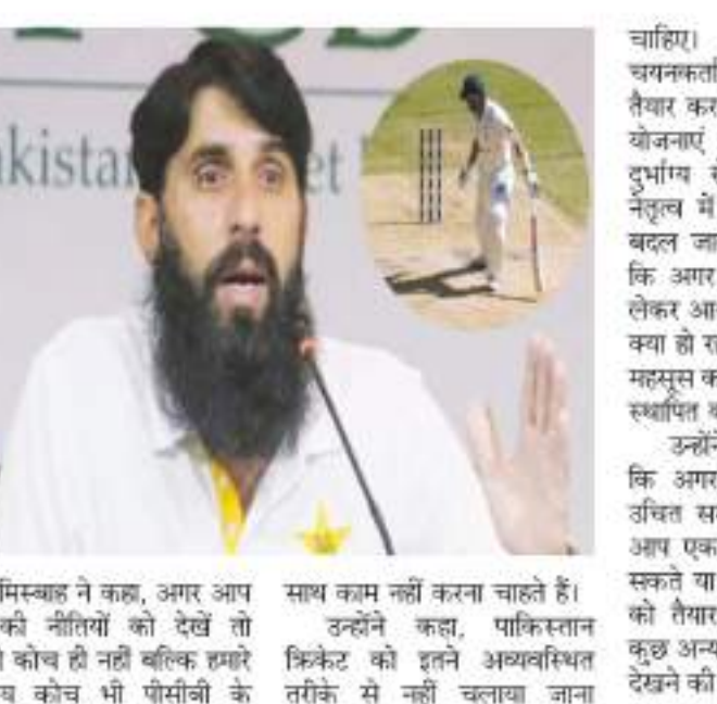
दे रहे मिस्बाह ने कहा, अगर आप बोर्ड की नीतियों को देखें तो विदेशी कोच ही नहीं बल्कि हमारे स्थानीय कोच भी पीसीबी के साथ काम नहीं करना चाहते हैं।

कराची. पाकिस्तान के पूर्व कप्तान मिस्बाह उल हक का मानना है कि पाकिस्तान क्रिकेट बोर्ड (पीसीबी) में अनिश्चितता और उसकी अदृष्टदर्शिता के कारण विदेशी और यहां तक कि स्थानीय कोच भी देश के क्रिकेट बोर्ड के साथ काम नहीं करना चाहते हैं।