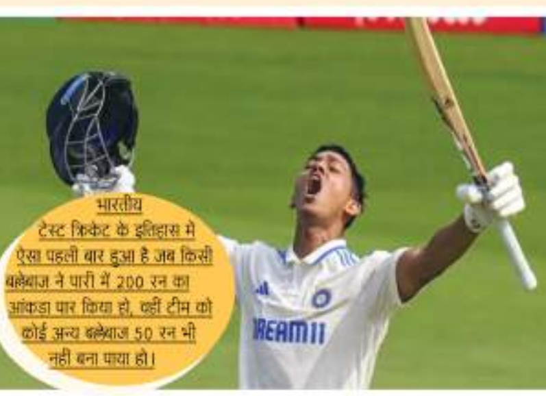
भारतीय टेस्ट क्रिकेट के इतिहास में ऐसा पहली बार हुआ है जब किसी बल्लेबाज ने पारी में 200 रन का आंकड़ा पार किया हो, वहीं टीम को कोई अन्य बल्लेबाज 50 रन भी नहीं बना पाया हो।

ऑस्ट्रेलिया मुकामले में घटी थी, जब ब्रायन लारा ने 226 रन बनाए थे और डेविन ब्रावो 34 रनों के साथ दूसरे सर्वाधिक रन बनाने वाले बल्लेबाज थे।