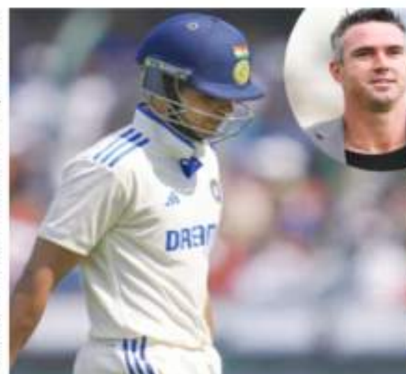
गिल के सपोर्ट में उतरना पड़ा है। पूर्व इंग्लैंड कप्तान का कहना है कि साउथ अफ्रीका के लीजेंड जैक कैलिस का भी पहले 10 टेस्ट में औसत 22 का ही था, मगर वह बाद में इस खेल के महान खिलाड़ी बने।

नई दिल्ली. इंग्लैंड के पूर्व कप्तान केविन पीटरसन ने टीम इंडिया के उभरते सितारे शुभमन गिल की तुलना साउथ अफ्रीका के लीजेंड जैक कैलिस से कर दी है। यह तुलना उन्होंने गिल के इंग्लैंड के खिलाफ जारी टेस्ट सीरीज में खराब प्रदर्शन के बाद की।